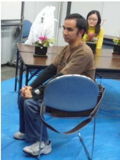
CHITSANU ( 泰国 )