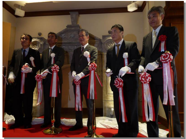
▲当時の様子を再現した「ルナ・パーク」のジオラマ(※1)公開と百年祭のスタートを祝してテープカットを実施(通天閣)。