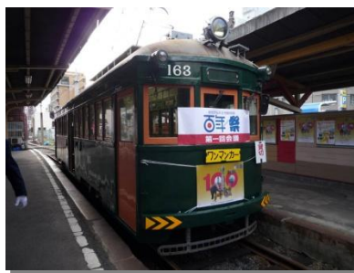
▲第1回会議に特別に仕立てられた「百年祭記念号」。車両は1928年製造の日本最古の電車(※2)。

第1回会議の様子▶ 会議は実際に電車を走らせて行われた。会議では百年祭実施に向けて各委員が企画について意見を交わした。