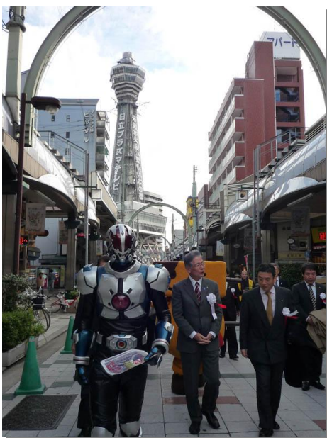
▲百年祭をPRしながら新世界「通天閣本通商店街」を歩く委員会一行。